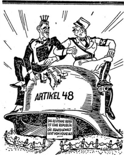
Zum 11. August.

herbeizuführen, die gerade auf diesem Gebiet in besonderem Maße gesucht werden müßte. Denn diese 60 Millionen bedeuten ja nicht etwa eine Behebung des Straßenbaues über ein normales oder auch nur über ein bescheidenes Straßenbauprogramm hinaus, sondern sie stellen einen einzigen Teilansatz für die ganz unerträgliche Drosselung, die der Straßenbau in den Etats der Wegeunterhaltungspflichten besonders für das laufende Jahr erfahren hat. Die Herunterdrückung auf etwa ein Viertel der Durchschnittpflichten in den letzten Jahren bedeutet eine Preisgabe des deutschen Straßenbaues an den unaufhaltsamen Verfall und eine Vernichtung von Milliardenwerten der deutschen Volkswirtschaft. In dem Jahrzehnt 1914/24 ist ein Fehlbetrag an Straßenbau-Investitionen in Höhe von mehreren Milliarden Mark entstanden. Gerade jetzt ist die Stunde gekommen, bei Gelegenheit der Arbeitsbeschaffung die schweren Unterlassungen der Vergangenheit wenigstens teilweise wieder gutzumachen.