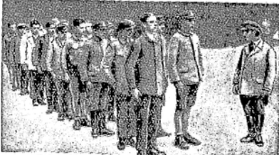
Keine Arbeiter mehr, sondern Muschikoten.

Der Vorarbeiter ist zum Unteroffizier geworden. Wie muß dem Scharfmacher das Herz im Leibe lachen. Wie haben sie solche Schugarde gehabt wie diese freiwilligen Pinkertons der Firma Hitler.