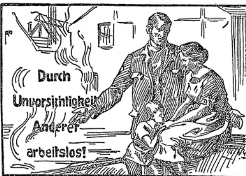
Unfallverhütungsbild G. m. b. H., Berlin W 9, beim Verband der Deutschen Berufsgenossenschaften.