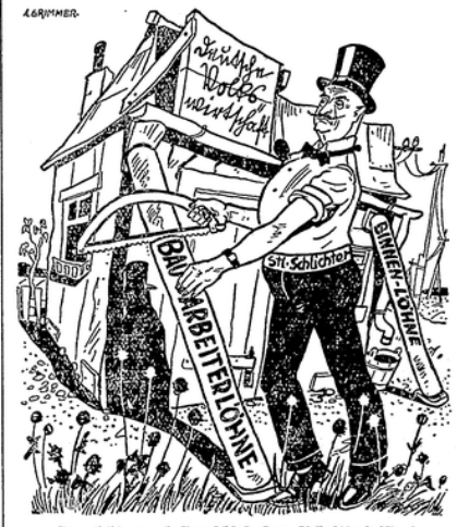
So geht's am besten schief, Herr Arbeitsminister!

Im Lohngebiet Ostpreußen wurde bei den Facharbeitern in sämtlichen acht Lohnklassen der Lohn durchgängig um 15 \frac{1}{2} je Stunde herabgesetzt. Dadurch ist prozentual gesehen der Abbau in der ersten Lohnklasse am niedrigsten, in der letzten am höchsten. Der prozentuale Abbau bewegt sich zwischen 14,3 und 20,5 %. Bei den Tiefbauarbeitern wurde der Lohn in der ersten Lohnstufe von 84 auf 61 \frac{1}{2} , das sind 4,7 % gesenkt. In den nächsten sechs Lohnklassen beträgt der Lohnabbau 4 oder 5 \frac{1}{2} je Stunde, in Prozenten ausgedrückt 6,2 bis 9,1 %. Die niedrigste Lohnstufe wurde am härtesten betroffen; hier senkt sich der Lohn von 55 auf 46 \frac{1}{2} je Stunde, das sind 16,4 % Lohnneubau.