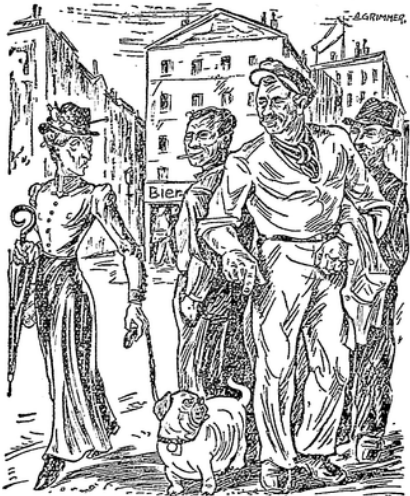
Sohempört kaufte, „Madamelen“ mit ihrem „Handeten“ davon.