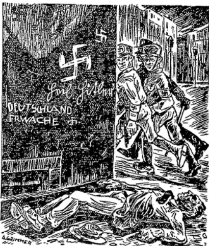
Nun ergriffen die Rowdys in aller Eile die Flucht.

Ernst war eilige Schritte zurückgesprungen und sah nun die Angreifer in ihrer vollen Größe und Gestalt vor sich. Er überlegte nicht — entweder mußte er sich wehren, oder . . . Schon war er auf den zunächststehenden Zugsprungen — bauz — klatsch! — ein unterdrückter Schmerzensschrei war die Antwort. Ja, Ernst Böhle hatte eine Handgelenk, die nicht zu verachten war. Aber er sollte doch bei diesem Ringen den kürzeren ziehen, denn schon sauste