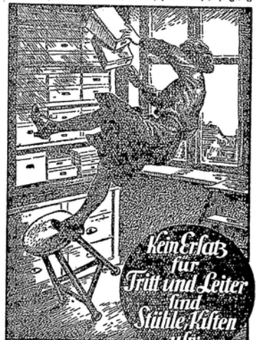
Unfallverhütungsbild G. m. b. H. beim Verband der Deutschen Berufsgenossenschaften, Berlin W. 9.

Uns diesen erschreckend hohen Zahlen sieht man, daß nicht nur Maschinen, Transmissionsen, explosive Gase, Grubenkatalstropfen usw. Schuld sind an der noch immer viel zu großen Zahl von Unfällen. Vielmehr ruht auch in der Scheinbar einfachsten und harmlosesten Beschäftigung des