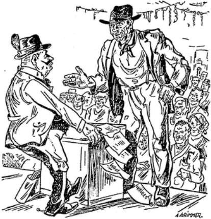
Es war, um sich den Bauch zu halten, wenn er einem hoch-geblatenen, blechmedernden Sendling ... den Kopf wusch.

Jawohl, der Maientag ist dein, Du Proletar, und immer soll er sein Dein Tag, dein leuchtender Maientag! An diesem Tag stehst du bereit Zum Kampfe für eine neue Zeit, Für neue Menschen, für freudvolles 'eben, Daß die Früchte der Arbeit allen gegeben; Du forderst, daß alles Menschenleid Sich wandle in Glück und Gerechtigkeit — Dafür schwörst du zu kämpfen im grünenden Hag Am freiheitverkündenden Maientag! Toofa.