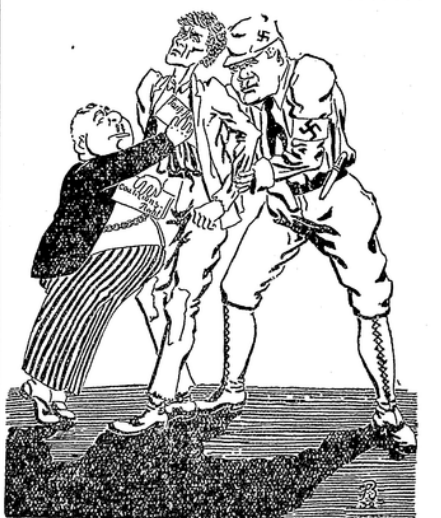
Der Wähler wird nur dann gequält, wenn er den Quäler selbst gequält!