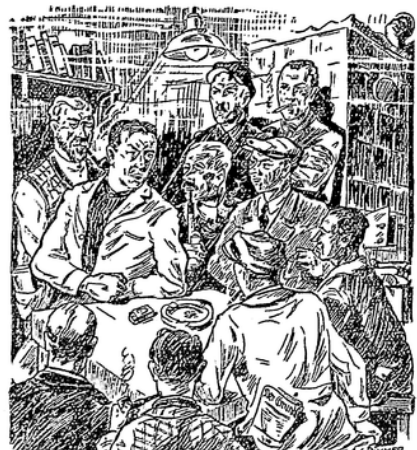
— und dann sagt Hinnak langsam, aber hart und fest: Selbsthilfe durch Danken!

Und doch müssen wir uns helfen, wir Unteren, wir Volk, wir Erwerbslosen. — Aber wie? — Hinnak macht 'ne spitze Schnut und kluge Augen, dann spuckt er mal zwisch die Beine auf den Boden, dann wipft er sich mit dem Handrücken über den braunen Schnabel — und dann sagt Hinnak langsam, aber hart und fest: Selbsthilfe durch Danken! Erfinden müssen wir was! — Oho, Hinnak, was denn, das fünfte Rad am Auto? — Na, na, laß das Lachen, es ist Ernst: Aus den gegebenen Grundstoffen, die wir haben, da heraus müssen wir neue Industrien auf-