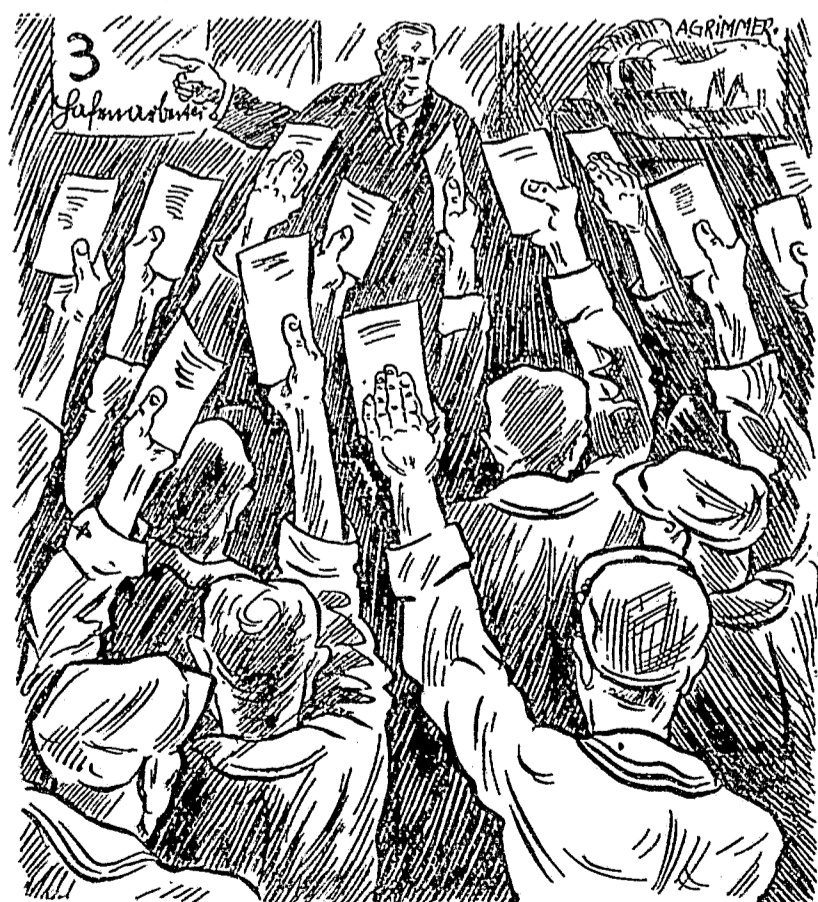
Wie auf Kommando fliegen alle Hände hoch.

Je näher die Arbeiter dem Hafen kommen, desto dichter werden die Menschenmassen, die sich ihm zu Knäueln geballt entgegenwühlen. In allen Fahrstellen herrscht Hochbetrieb. Vollgepropte Dampfer schlucken die sich anstauenden Massen und bringen den riesigen Menschenstrom auf die andere Elbseite, wo die Werften liegen, die gleich gefräßigen Ungeheuern Dampfer auf Dampfer in ihre unerfülllichen Mägen aufnehmen. Das Heulen der Sirenen und Fauchen der Schleppzüge vermischt sich mit den in allen Tonarten kreischenden Fabriksignalen. Die Großstadt erwacht. Der erste Fuhrverkehr setzt ein. Wie ein unruhig zuckender Nerv liegt der Hafen da. Barkassen und Schleppdampfer huschen über den Strom. Das dumpfe Lufden der hereinkommenden Schiffe überläßt das Wimmern der Kräne. Wie schwarze Schlagschatten gleiten die riesigen Kolosse vorüber. Es sieht aus, als wenn ein ungeheurer Riese erwacht ist und seine einzelnen Glieder in Bewegung setzt. Das ist die Melodie der Arbeit, die so unendlich schön für den — Zuschauer ist, der dieses Gassen und Loben nicht mitsprechen braucht und dies alles aus der Perspektive des Beobachters genießen kann. Aber wo sollen die armen Kreaturen, die hier in Eile der Werk zustreben, ein Gefühl für die Poesie des Morgens hernehmen! Ein satter Magen und einige Tage Arbeit ist ihnen lieber als die ganze Schönheit des Morgens. Im Freihafen liegen die verschiedenen Vermittlungsfäle