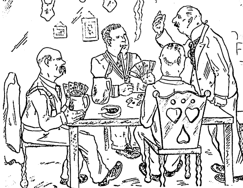
„Spielt's mit dem Käfer, den Ihr im Kopf habt!“

Natürlich bin ich aufs Teufelsrad. Dieses Teufelsrad wäre ein Engelsrad, wenn es sich bloß nicht drehen wollte! Siegesgewiß stellt du dich drauf, hältst dich für festgemauert in der Erden, und bumz, liegt du auf der Tafel! Ich bin auf der Drehscheibe herumgelaufen, als spielte der Riese Goliath mit mir Schuster, die Leni hat gejauchzt vor Wonne, mein Hosensboden glich der Reibfläche einer Zündholzschachtel — auf einmal packt mich eine Hand beim linken Haß und will mich als Rettungsring benutzen! „Loslassen, AGRIMMELK.“