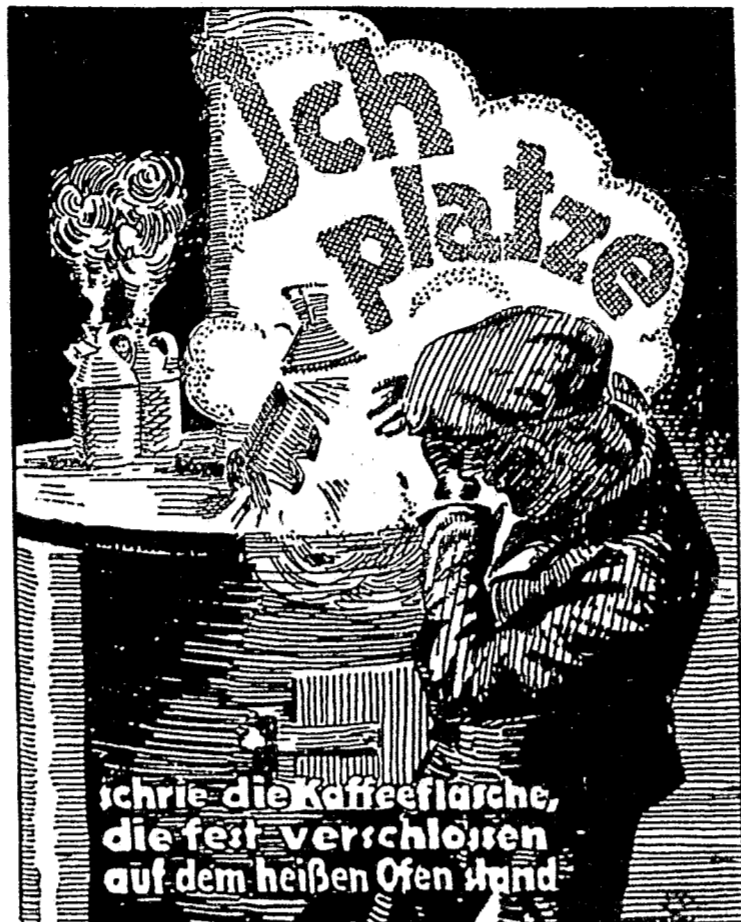
Bestell-Nr. — 249 — der Unfallverhütungsbild G. m. b. H. Berlin W 9, beim Verband der Deutschen Berufsgenossenschaften

Leider hat aber solche Kleinigkeit unter Umständen unabsehbare schwere Folgen. Es sind zahlreiche Fälle bekannt geworden, in denen schwere und schwerste Ver-