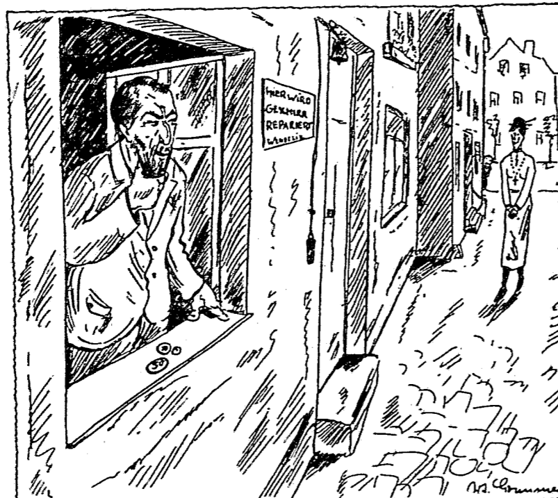
Einige Minuten später lagen 61 Pfennig auf dem Fensterbrett.