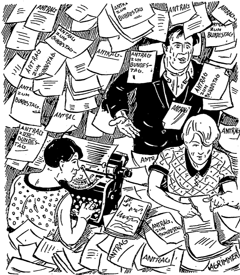
Die Flut der Anträge zum Bundestag im Hauptbüro.

Düsseldorf. Die Invalidenunterstützung soll schon nach Leistung von 600 Beiträgen gezahlt werden. Breslau (Fachgruppe der Bauhilfsarbeiter). Die Anzahl der zum Unterstufungsbezug erforderlichen Beiträge soll in der 1. Stufe 600, in der 2. Stufe 800, in der 3. Stufe 1000 und in der 4. Stufe 1200 betragen. Buer. Die Anzahl der zum Bezug der Unterstützung erforderlichen Beiträge ist in jeder Stufe um 100 herabzusetzen. Auerbach. Die Höhe der Unterstützung soll sich nach Mitgliedsjahren richten, und zwar soll sie betragen: nach 20 Mitgliedsjahren 20,- M monatlich, nach 25 Mitgliedsjahren 23,- M monatlich und weiter steigend nach je 5 Mitgliedsjahren um weitere 3,- M. Brandenburg. Die Invalidenunterstützung ist auf Altersrentner in der Weise auszudehnen, daß ihnen nach mehr als 13 Wochen Arbeitslosigkeit die Unterstützung gezahlt wird. Die Unterstützungssätze sollen nach 500 Beiträgen mit 5,- M monatlich beginnen. Nischaffenburg, Kiel, Osnabrück, Muskau. Falls eine Erhöhung der Invalidenunterstützung unter den gegenwärtigen Finanzverhältnissen des Bundes nicht durchführbar ist, soll geprüft werden, ob die Erhöhung durch die Erhebung eines Ertragsbeitrages möglich gemacht werden kann. Dachau. Falls die Anzahl der zum Invalidenunterstützungsbezug erforderlichen geleisteten Beiträge von 800 auf 900 erhöht wird, möge der Bundestag beschließen: "Mitglieder, die bis zum diesjährigen Bundestag 750 Beiträge geleistet haben, erhalten Invalidenunterstützung nach Leistung von 800 Beiträgen.