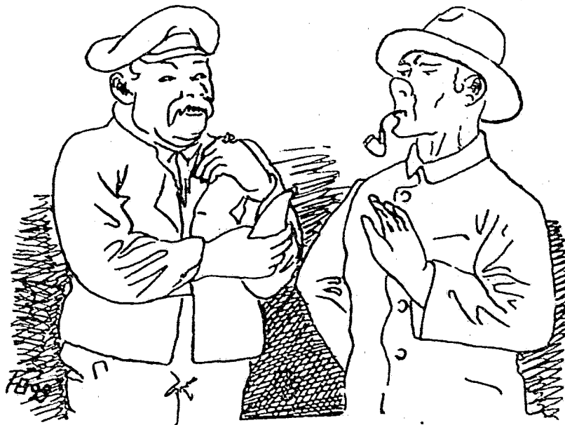
„August nimm ö Prischel!“ — „Dank schön Koar! Ek schnuv nich.“ — „Wa—a—af? Wozu heft denn die Nees?“

Immer nach der Fähigkeit! Wie das Buch „Wiß und Humor bei der Polizei“ von Heinrich Langmach (Deutscher Polizeiverlag, Lübeck) mitteilt, befindet sich im „Kommentar zum Strafgesetzbuch“ des Oberlandesgerichtsrats Schwarz auf Seite 44 der Ausgabe von 1927 unter der Ueberschrift: „Arbeitszwang bei Festungshaft“ folgender Passus: „Landreicher und Wirnen können auch bei Haft zu ihren Fähigkeiten entsprechendem Außen- und Innenarbeiten angehalten werden.“ Wie Außen- und Innenarbeiten den Fähigkeiten nach zu verteilen sind, darüber dürfte in diesem Fall kein Zweifel bestehen.