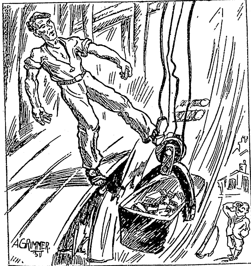
Ein Knistern und Krachen folgt dem Schrei.

Fleißig arbeiten die Kollegen. Stein sügt sich an Stein. Jeder tut seine Pflicht. Am Aufzug beladen die Kollegen diesen mit Steinen. Ich bin erstaunt über die starke Belastung.