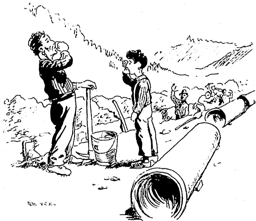
Im Sommer mußte er die Durstigen tränken . . .

Aber wenn es ihm auf diesem seinem ersten Ausflug in den kalten Norden so gut ergangen war, so war das vor allem seinem zärtlich geliebten „babbo“ zu verdanken, der seit fünfzehn Jahren die Schweiz, Oesterreich und Süddeutschland durchzogen hatte auf der Suche nach Brot, das ihnen die Heimat nicht geben konnte. In solch langer Zeit hatte er gelernt, den Gefahren zu begegnen, von denen die armen, unwissenden italienischen „emigranti“ bedroht