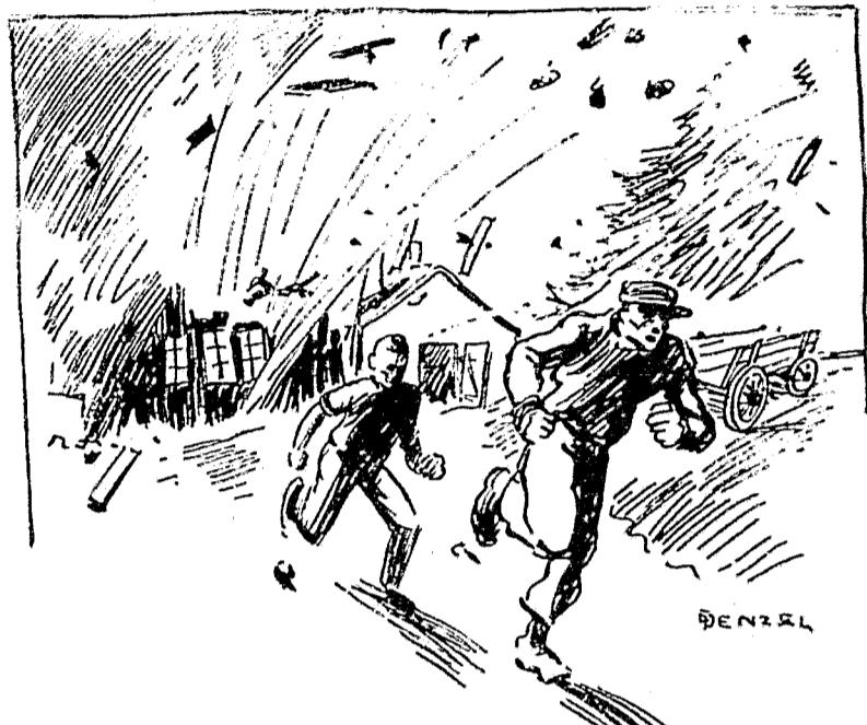
Pötzlich ein fürchterlicher Knall . . .

Sie waren jetzt nach halbstündiger Wanderung am Verleseplass angekommen. In der Nacht hatte es leicht