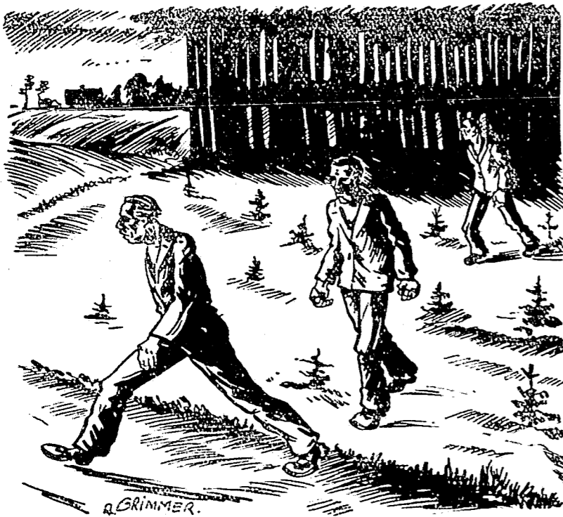
Auffspringen und auf die Chaussee rennen . . .

Und dann ging es weiter. Das nächste sehenswerte Ziel war Hildesheim. Die Altfeindlichkeiten der Stadt wurden gemuffert, auch der tausendjährige Rosenstrauch. Geschlafen wurde diesmal im Gewerkschaftshaus. Dann sollte es nach