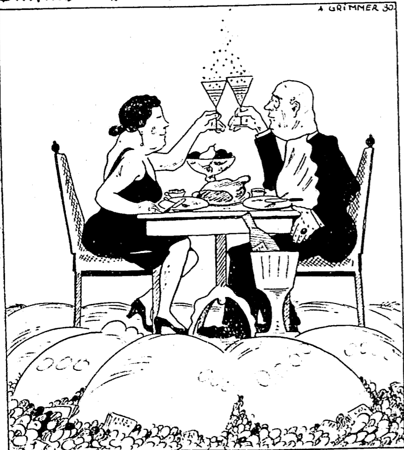
Der Vorstand der Dresdener Bank fordert auf zur Erziehung zu einfacher Lebensführung in den öffentlichen und privaten Haushalten.

Eine Flagge mit einem großen schwarzen Hakenkreuz auf weißem Felde weht dem kleinen Zug voran.