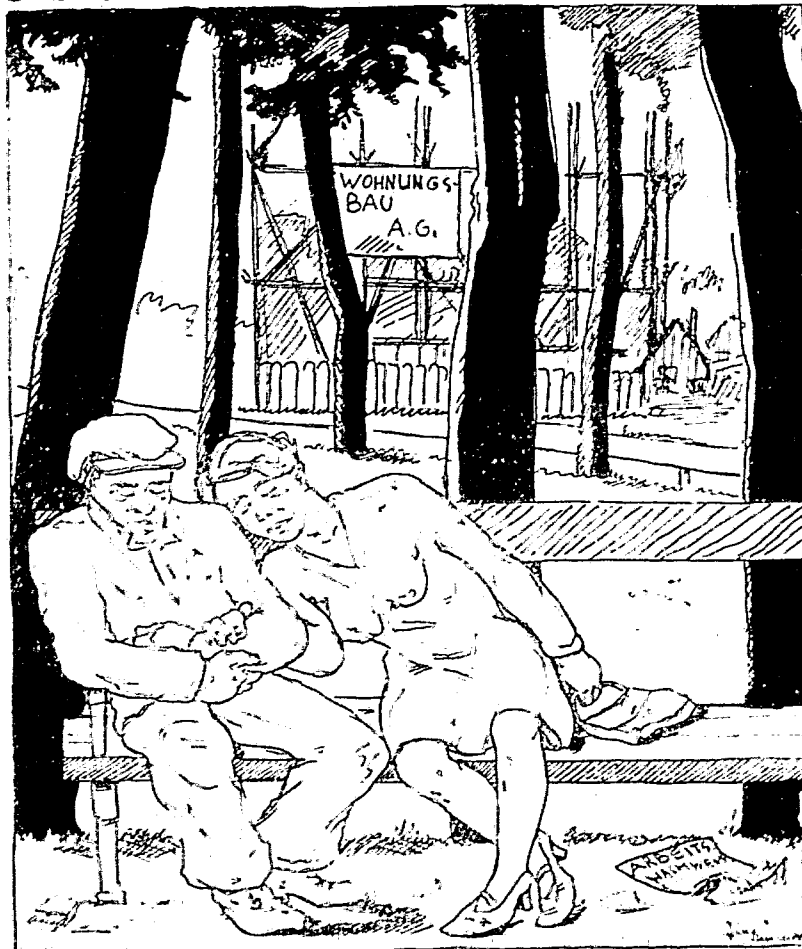
Es lenzt schon!

Das Leben selbst ist einkönig, besonders bei den Arbeiten, die fern von einer Stadt ausgeführt werden. Um sechs Uhr früh aufstehen, die Arbeit beginnt um sieben. Die