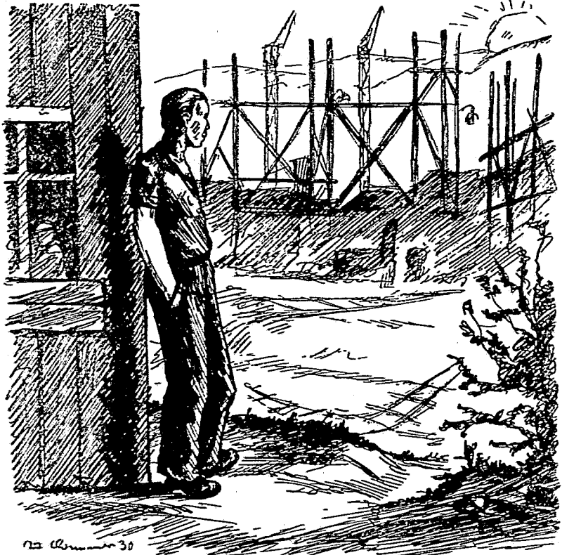
Der junge Bauarbeiter lehnte gedankenverloren an der rohgezimmerten Baubude.

Fern am Horizont quoll in sieghafter Schönheit das große stille Leuchten der aufgehenden Sonne auf. Die gischgefürmten Wolken schoben sich steil hoch und färbten sich rot wie wilder Wein.