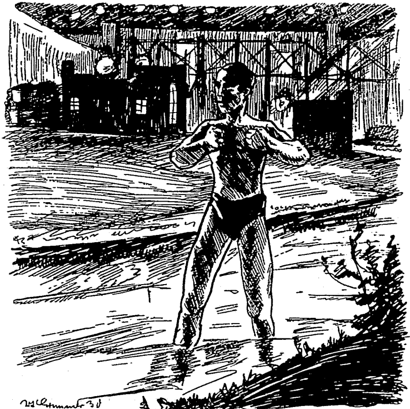
Da wuchs die nackte Gestalt des Proleten trotzig auf.

Dief Lemmen schlug einen Feldweg ein, der zum Fluß hinabführte. Die Lichter vom Kraftwerkbau tanzten ge-