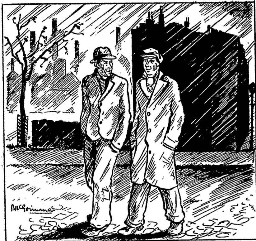
Er hielt mich von seinem Standpunkt aus eine Moralpauke.

Die unfreundliche Stimmung des Tages scheint sich auch auf die Menschen zu übertragen. Ein jeder ist kurz angebunden. Oder scheint es nur so? Jedenfalls hört man selten ein fröhliches Lachen oder ein freundliches Wort. Mit Schrecken denkt jeder an den vorigen harten Winter, er friert schon im voraus, wenn er seine kargen Wintervorräte