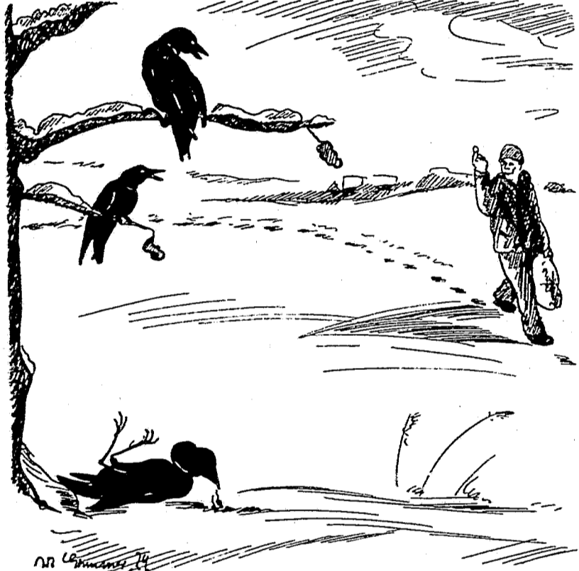
Wenn wir Wild nicht mehr mochten, holte mein Vater Geflügel.

Darauf hatte der alte Siebert gelauert. Vorn wäre er dem Gesellen über das lose Maul gefahren, aber er beherrschte sich und meinte: „Du hast recht. Früher war das anders. Ich brauche bloß an meine Jugend zu denken. Wir hatten immer im Ueberfluß zu essen. Im Winter öffnete mein Vater das Kellerfenster, bräute einen Kohlkopf auf und warf ihn in den Keller. Am nächsten Tage ging er mit einem Holzschiefel in den Keller und schlug die Hasen,“