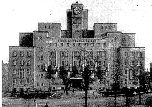
Vorderansicht des Amalienbades.

früheren hohen Mieten wurde die Lebenshaltung der Arbeiter stark herabgedrückt. Heute ist das Unbedeutende Ziele der Mieterbeschäftigung, dann mühten die Löhne in die Höhe schnellen und das wäre in Rücksicht auf die Exportindustrie (zu 70 % ist die österreichische Industrie auf den Export angewiesen) für das verarmte Land verberblich. Die Wettbewerbsfähigkeit wäre beseitigt. Lebensmittel und Rohprodukte müssen eingeführt werden; Kohle ist fast gar nicht vorhanden. Die Nahrung und Kleidung des Arbeiters herabzudrücken, ist unmöglich, deshalb ist der Fortbestand des Mieterbeschäftigten das höchste wirtschaftliche Gebot. Aus den gleichen Gründen hat die Gemeinde Wien eine Abneigung gegen die Aufnahme von Anleihen für den Wohnungsbau. Die Folge einer Anleihepolitik wäre eine gewaltige Steigerung der Mieten, und die notwendig zu erarbeitenden Zinsen würden dazu auch ins Ausland fließen, was wiederum ein unerwünschter Zustand wäre. Privatbaufähigkeit ist so gut wie ausgeschlossen. Entsprechend den Baukosten und der Verzinsung des Bankkapitals mühten die Zinsen für Kleinwohnungen so hoch gedrückt werden, daß sie wohl an 60 % des heutigen Lohnes eines Arbeiters ausmachen würden. Das heißt auch das Privatkapital ein; es hat sich im Wohnungsbau nicht hervorgezeigt, trotz der dreißigjährigen vollen Steuerfreiheit, des Kündigungsrechts und der uneingeschränkten Forderung des Mietzinses in den Neubauwohnungen.