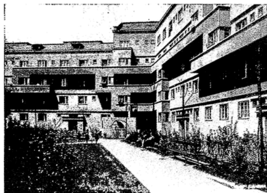
Garten im städtischen Wohnbau „Bebelhof“, Wien, 12. Bezirk.

Der Flachbau konnte zur Bezwingung der Wohnungsnot nicht ausreichen, weil nicht nur das notwendige Siedlungsgelände, sondern auch die Verkehrsmöglichkeiten fehlten. Von 1919 bis 1923 wurden 7259 Wohnungen geschaffen und dann im Herbst 1923 ein langfristiges Bauprogramm von 25 000 Wohnungen beschlossen. In 4 Jahren war dieses Programm erfüllt. Nun wurde beschlossen, sofort noch 5000 und dann später wieder 30 000 Wohnungen zu bauen, die bis zum Jahre 1932 fertig sein sollen. Von diesen insgesamt 60 000 Wohnungen sind bereits 40 000 fertig gestellt. Die Gemeinde gab in dem Jahrzehnt von 1923 bis 1927 390 Millionen Schilling für Wohnbauten aus. Gleich-