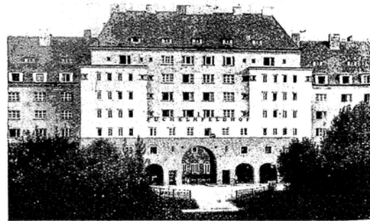
Der städtische Wohnbau „Buchsenshof“, Wien, 12. Bezirk.

Kleinstwohnungen (1 bis 1 1/2 Räume) ..... 73,21 % Kleine Wohnungen (2 Räume) ..... 9,35 % Mittelwohnungen (2 1/2 bis 3 1/2 Räume) ..... 12,58 % Großwohnungen (4 und mehr Räume) ..... 4,86 % Die Wohnungsnote nach dem Kriege zwang auch die Gemeinde Wien, die Mieter vor dem Wucher der Hausbesitzer zu schützen. Vor allem wurde darauf geachtet, daß die notwendigen Säufereparaturen geleistet wurden. Wo die Hauseigentümer mutwillig die Instandsetzung ihrer Häuser verweigern, greift die städtische Baubehörde ein. Die entstehenden Kosten werden auf die Mieter umgelegt. Während vor dem Kriege im Durchschnitt der Wohnungsaufwand für den Arbeiter gegen 2 1/2 % seines Einkommens betrug, steht er heute auf etwa 2 1/2 bis 3 1/2 %. Der Mietpreis beträgt einschließlich der Aufwendungen für die alten Häuser etwa 12 bis 14 % der Friedensmiete. Durch die