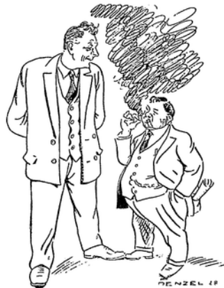
Der kleine Syndikus: „Runter mit dem Barabertohn!“ Der Große: „Dass gibst' sei nit!“

Vermittels zweier Sachverständigen Soll sie die Gegenseite bändigen Ein solcher Spruch ist sehr probat; Er zeigt mit Glanz den Tugendpfad Der strengen Unparteilichkeit. Zudem gibt er den Wegnern Zeit, Sich möglichst reichlich abzukühlen, Um dann von neuem zu befehlen Den Fall mit ungetrübtem Blick Und zu erledigen mit Geschick. — Indessen ist es abends sieben Und manches ist zurückgeblieben. Jedoch der Besteszwirn wird knapper Und auch das Maschelzeug wird schlapper; Es klappert manches Aug' oerdrossen Und schwer bewegen sich die Flossen, Weshalb der Herr Präside spricht: