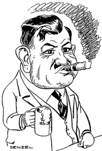
Der Syndikus der Bajuwaren: „Mir san mir und schreiben und uns! A Wasa, a Weltwurst und an Kade: Das is unsa Meisterrecht.“

Der Chronometer zeigt halb zehn Und viele sitzen, manche stehen Im Haupttarifamts-Sitzungszimmer, Wo man gewöhnlich — beinah' immer — Das Recht im Baugewerbe hegt Und leiblich Recht zu sprechen pflegt. Man harret erwartungsvoll der Dinge, Ob's Segen oder Unheil bringe; Und schließlich ist auch alles da, Von ferne her und der von nah: Die Kläger, Angeklagten, Richter Und sonstiges Prozeßgeschicht. Ernst — in Ermanglung einer Stoa — Pocht der Präside mit dem Stoa Des Weisheits auf des Tisches Platte — Nachdem er sich gesammelt hatte — Und sagt sodann nach kurzem Sinnen: „Wir können nunmehr wohl beginnen.“ Und nun entfremdet der heiße Streik Von wegen der Gerechtigkeit. Der erste Fall: die Bajuwaren Eind sich noch immer nicht im Klaren, Ob nach dem Reichstariabkommen Der Lehrbus' Ferien soll bekommen.