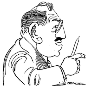
Der Berliner Syndikus: „Die Baubude ist verkräft geworden.“

Im Sonderlöhne einzustreichen Und außerdem den Fahrigenuß Zu schlürfen bis zum Ueberfluß; Die Forderung sei frech unsagbar, Und fürs Gewerbe gar nicht fragbar, Auch gäb' es nirgends — wech ein Glück! — In dieser Art ein Seitenstück! — Jedoch der fulminanten Rede Wied widersprochen. Grob und spröde Erwidert man dem Syndikus, Es sei durchaus kein Hochgenuß, Sich stundenlang an jedem Tage Der bösen, unbequemen Plage, Der Eisenbahnfahrt auszuwehen Und sich noch extra abzusehen; Judem noch werde dann verengert Die Freizeit und die Fron verlängert. Das Recht verlange, solche Qualen Dem Bauproleten zu bezahlen. — So wagt in Dunst und Tabaksdampf Der kraftgeschwefelte Redekampf. Das Haupttarifamt aber findet, — Obwohl man alles stark begründet — Daß dieser Fall zu sehr verwickelt; Und so verweist es sehr geschickt Den Fall mit großer Eleganz Zurück an seine Vorinstanz,