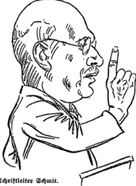
Der Schriftleiter Schmitz.

dem Ermessen des Reichsarbeitsministers bestimmte Berufe und Bezirke vom Bezug der Unterfützung ausgeschlossen werden können. Für den Bezug von Krisenunterfützung ist wie bisher die Bedürftigkeit maßgebend. Es darf wohl erwartet werden, daß diese Prüfung nach einheitlichen Richtlinien vorgenommen wird. — Die Voraussetzungen für den Bezug von Erwerbslosenunterfützung sind im allgemeinen dieselben wie bisher. Der Unterfützungsberechtigte muß arbeitsfähig und arbeitswillig, ohne eigenes Verschulden arbeitslos geworden sein und den Anspruch durch Beitragszahlung erworben haben. Eine kleine Verbesserung ist darin geschaffen worden, daß nicht mehr wie bisher jede Arbeit angenommen werden muß. Bei veränderten Verufen besteht jedoch nur in den ersten 9 Wochen Anspruch auf Beschäftigung im engeren Beruf. Nach Ablauf dieser Frist kann Arbeitsaufnahme in einem andern Beruf nur noch dann verweigert werden, wenn der Erwerbslose durch Beschäftigung in dem andern Beruf in