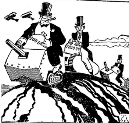
Die kapitalistische Internationale.

Menschen — das waren und sind in der kapitalistischen Produktion die Faktoren, die miteinander vereinigt werden müssen, um den Lebensbedarf der Menschen zu befriedigen. Wie wir gesehen haben, gibt es überall freies Kapital genug. Vorhandene Arbeitskräfte ebenfalls. Genügend stehen davon noch in Reserve. In Europa beträgt auch heute noch die Arbeitslosenarmee 5 bis 6 Millionen. Diese Massen schreien nach Arbeit. Geld wäre genügend vorhanden, die freilegenden Arbeitskräfte in den Produktionsprozess einzuschalten. Der Warenmarkt könnte wesentlich erweitert werden, wenn überall die nötige Kaufkraft vorhanden wäre. Die geringe Kaufkraft der breitesten Volksmassen beengt den Warenmarkt.