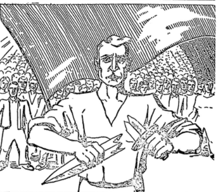
Ihre Macht zerbricht die Internationale der Arbeit.

Denkschrift über die Neuordnung der Rechtsansprüche an Betriebspensionskassen. Die freigewerkschaftlichen Spitzenverbände der Arbeiter und Angehörigen, der AGO, des und der IFA-Bund, haben dem Reichstag und der Reichsregierung zu den Beratungen über die Durchführungsbestimmungen zum Aufwundengesetz eine Denkschrift über die Neuordnung der Rechtsansprüche an Betriebspensionskassen unterbreitet. Sie verweist einleitend darauf, daß