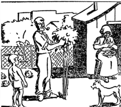
Festabend nach achtstündiger Arbeitszeit.