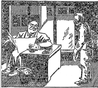
Mein bist Du nichts...

„Mit den in Preußen vorhandenen Bauarbeitern und Bauhilfsarbeitern können bei Einführung rationaler Arbeitsmethoden und unter der Voraussetzung, daß die Bauarbeiter ständig das ganze Jahr beschäftigt werden, 200.000 Wohnungen jährlich ohne weiteres gebaut werden. Die Verstellung der nötigen Baumaterialien würde gar keine Schwierigkeiten machen, da die Leistungsfähigkeit der Fabrikanlagen, die Lauffaste erzeugen, zum Beispiel Kugeln, nur zu einem verhältnismäßig geringen Teile ausgenutzt werden ist. Die Folgen der verminderten Bautätigkeit werden sein: infolge Verringerung des Arbeitsmarktes verlässliche Beschäftigung aller Bauarbeiter, Verringerung der Arbeitslosigkeit in all den Gewerbe- und Industriezweigen, also harter Mangel an der Erwerbslosigkeit, relativ schnelle Verringerung des Wohnungsnot und des Wohnungslebens, teils künftige Wohnungsplanung, Ersatz mangelhafter Wohnungen durch gute Wohnungen, damit Vermeidung der stillosen und gesundheitlichen Gefahren, die sich aus schlechten Wohnungsverhältnissen ergeben. Alle diese Vor-