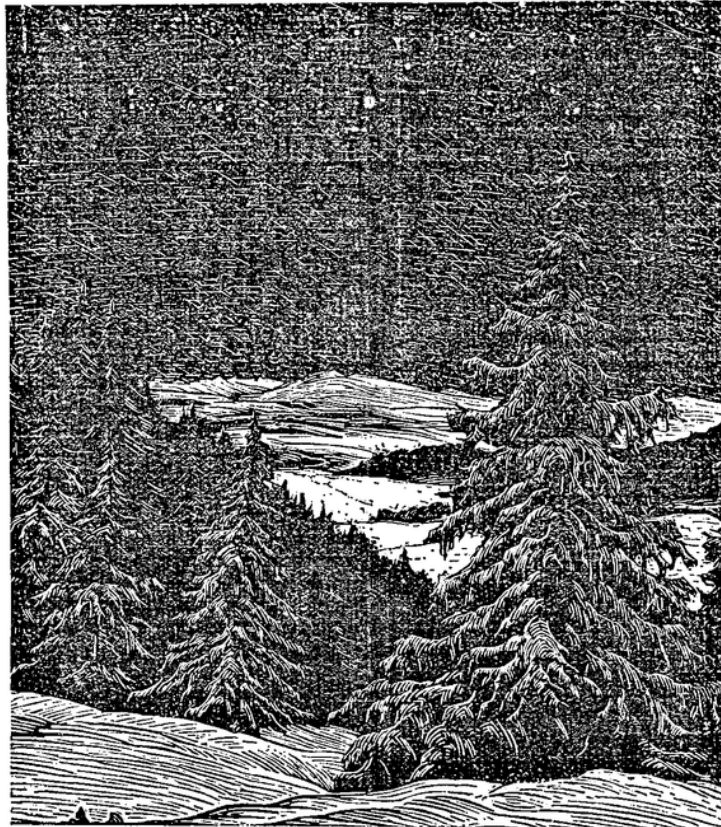
Weihnachten Aus dem Kalender „Kunst und Leben“, Verlag Fritz Heyder, Berlin-Zehlendorf

Gustl erklärt, daß er ganz besonders gern vor Kindern spielt. Das glauben wir ihm auch. Er sagt, er mache jeden Kopfsprung und jedes Radschlagen noch einmal so gern, wenn dort unten die kleine Masse der Kinder tobt. Man gönnt den zehntausend Kindern im großen Zirkus die kleine Freude, die den „Blaggesichtern“