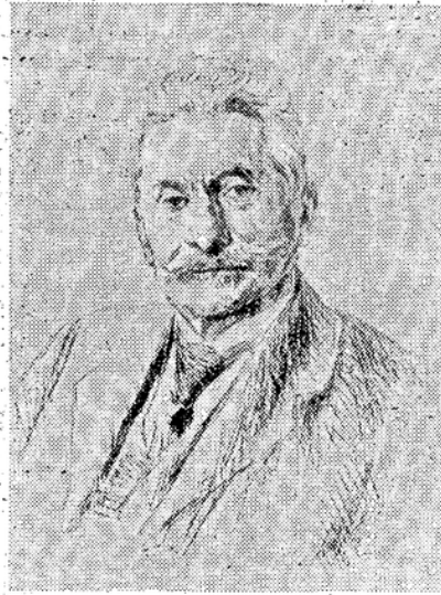
Radierung von Max Liebermann 1919

der Arbeiterschaft der vormals kaiserlichen Werften. In sachlicher Beschwerde (unwürdige Behandlung, Mafregelung, Verweigerung des freien Koalitionsrechts) nahm er im Reichstag alljährlich bei Beratung des Marineetat das Wort. Ebenfalls korrigierte er fast alljährlich die amtliche Streikstatistik, die unvollständig und voller Fehler war. Die Gewerkschaften veranstalteten eigene Erhebungen und oft ist durch Legien die Mitarbeit der Gewerkschaften der Regierung angeboten worden, wenn man in den amtlichen Erhebungsformularen auf die Fragen des Kontraktbruchs, die allzu leicht als kriminelle Verfehlungen der streikenden Arbeiter ausgedeutet werden konnten, verzichtete würde. — Sein Werk war es auch, Verbindungen mit den Gewerkschaften anderer Länder durch die Gründung des Internationalen Sekretariats, dessen erster Sekretär und Präsident er von 1902 bis zur Sitzverlegung des Büros nach Amsterdam 1919 gewesen ist, angeknüpft