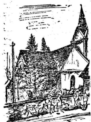
In den Flämern

Die Geschichte des Jugendherbergswerkes kann nicht geschrieben werden, ohne des Mannes zu gedenken, der sich seit 20 Jahren mit seiner ganzen starken Persönlichkeit für das Herbergswerk eingesetzt hat. Der Volksschullehrer Richard Schirrmann, Altena, ist es, der schon 1908 die Forderung aufstellte: „Jedem Ort, gleichwie Schule und Turnhalle, auch ein Gefäß für die wanderfrohe Jugend!“ Schirrmann benutzte die Schulferien, um mit seiner Klasse mehrtägige Wanderungen zu unternehmen. Neben Schwierigkeiten kleinlicher Art, die von der vorgesetzten Schulbehörde, von Eltern und anderen Stellen gemacht und die überwunden werden mußten, machte sich der Mangel an geeigneten Unterkunstmöglichkeiten für die Nacht immer wieder außerordentlich störend bemerkbar. Auf die Ueberwindung dieses letzteren Uebelstandes konzentrierte Schirrmann seine ganze Schaffenskraft. Sein Ruf fand Widerhall im ganzen Volke, seinen Bemühungen blieb der Erfolg nicht versagt. So ist aus kleinen Anfängen ein Herbergsnetz entstanden, das heute das ganze Reich überzieht und das auch in Oesterreich seine Maschen spannt.