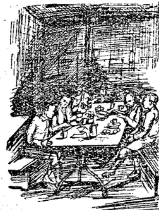
In der Jugendherberge Stendal

Träger des Herbergsgedankens ist der Verband für deutsche Jugendherbergen, der sich in Gauen und Ortsgruppen gliedert und der sowohl körperschaftliche als auch Einzelmitglieder aufnimmt. Die Spitzenverbände der Gewerkschaften (auch unser Verband ist korporatives Mitglied. D. Red.), die großen Turn- und Sportorganisationen, die verschiedenen Richtungen der Jugendverbände und viele andere Reichsorganisationen haben die körperschaftliche Mitgliedschaft erworben. Insgesamt gehören dem Verbands 204 Reichsverbände an. Die Gesamtzahl der Mitglieder beläuft sich auf etwa 90 000. Die Zeitschrift des Jugendherbergverbandes ist unentbehrlich, ihre Auflage beträgt 120 000 Exemplare. (Leider läßt diese Zeitschrift sowohl in Form wie Inhalt alles zu wünschen übrig. D. Red.)