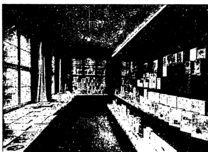
Ausstellungsstand auf der Leipziger Papierwarenmesse.