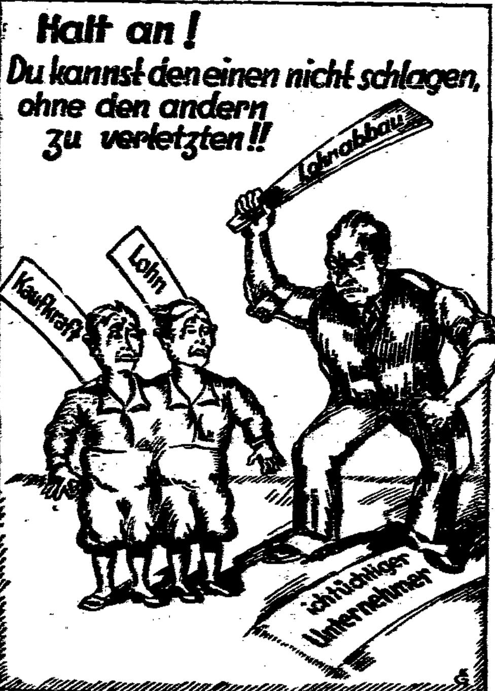
Diese volkswirtschaftliche Wahrheit muß auch das Reichsarbeitsministerium besser beachten.

Im gesamten gesehen sind die Beitragseinnahmen von 1930 auf 1931 um etwa 496 Millionen RM. gesunken. Die Reichszuschüsse und Reichsbeiträge haben sich aber auch erheblich, und zwar um 35,4 v. H., vermindert. Die Ueberweisungen an die Invalidenversicherung aus den Zollerträgen wurden erneut gekürzt. Die Zuschüsse aus dem Lohnsteueraufkommen fielen fort. Die Krankenversicherung erhielt für die Familienwochenhilfe nur eine geringfügige Entschädigung. Dagegen wurde der knappschaftlichen Pensionsversicherung aus Zollgeldern und sonstigen Reichsmitteln ein größerer Betrag zur Erhaltung ihrer Leistungsfähigkeit überwiesen. Die Gesamtzahlungen des Reiches an die Sozialversicherung betrugen im Jahre 1931 nur noch rund 702 Millionen RM. gegenüber 1087 Millionen RM. im Vorjahre. Die gesamten Einnahmen stellten sich auf 5,6 Milliarden RM. gegenüber 6,5 Milliarden RM. im Jahre 1930. Die gesamten Ausgaben beliefen sich ebenfalls auf etwa 5,6 Milliarden Reichsmark gegen 6,2 Milliarden RM. im Vorjahr. Während im Jahre 1930 noch ein Ueberchuß der Einnahmen