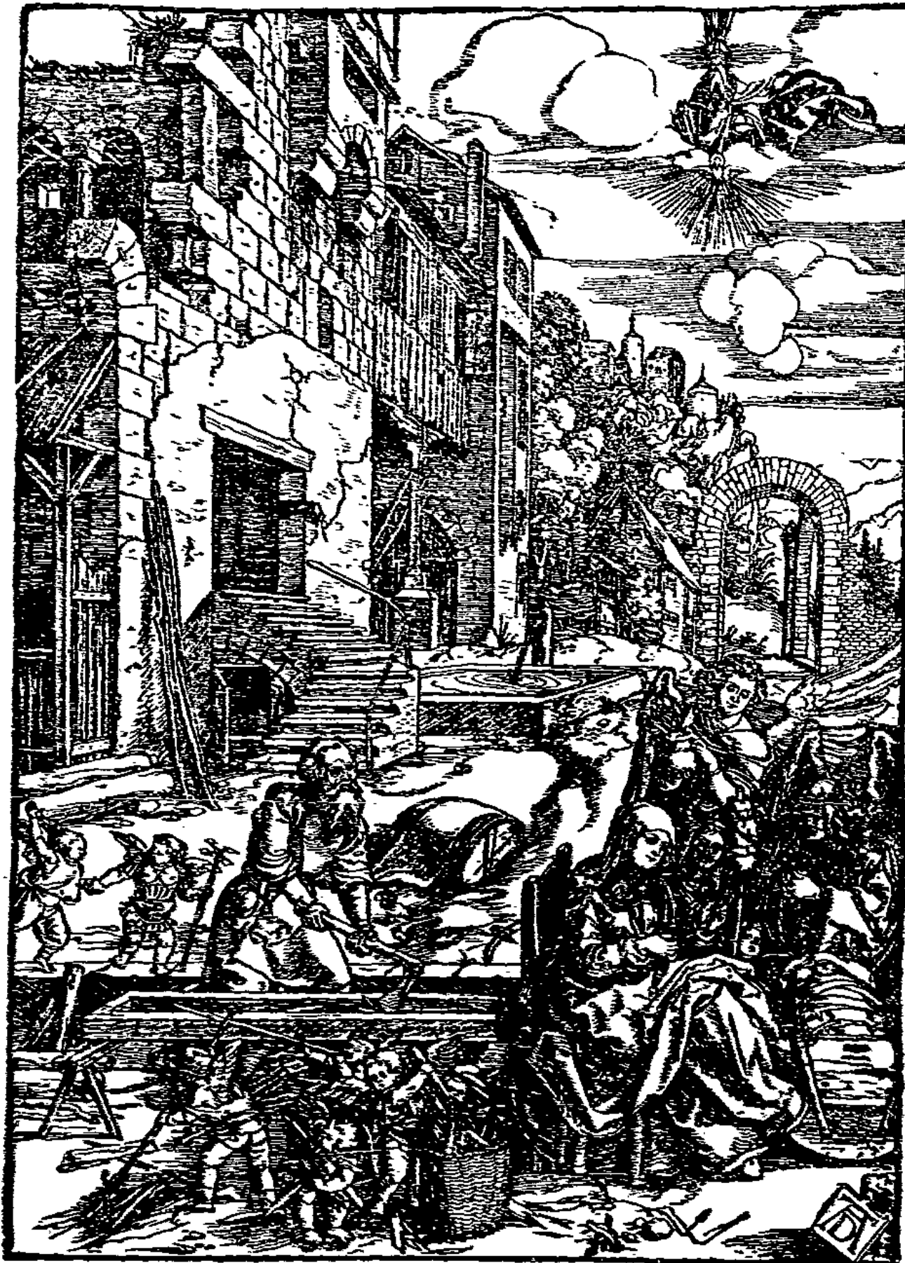
Die heilige Familie von Dürer.

Die reichen Erfahrungen, die dieser bemerkenswerte Fabrikant sammelte, legte er in einer Reihe vielbeachteter Schriften nieder. So kann man darin z. B. Ausführungen über die sehr günstigen Aus-