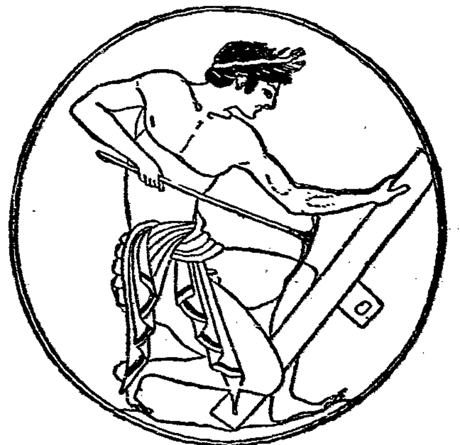
Abb. 6. Griechischer Handwerker (etwa 500 v. Chr.).

Doch der hörige gewerklche Arbeiter konnte die freie Zeit, die ihm die Hofronn noch ließ, auch auf andere Weise als Lohnwerkerverwerten, indem er nämlich fertige Gebrauchsgegenstände, deren Erzeugung sein Arbeitsfach war, auf Vocrat herstellte und bei passender Gelegenheit zu verkaufen suchte. Diese Gelegenheit bot ihm das sich entwickelnde Marktwesen. Der Markt war ein Platz, an dem sich zu bestimmten Zeiten die Händler, die sich mit dem Verkauf von Waren aus anderen Gegenden oder auch aus fremden Ländern befaßten, zusammenfanden, um ihre Ware feilzubieten. Auf diesen Märkten suchte auch der Hofwerker seine Erzeugnisse zu verkaufen, und in dem Maße, als die Märkte sich entwickelten und zu einer ständigen Einrichtung wurden, entwickelte sich