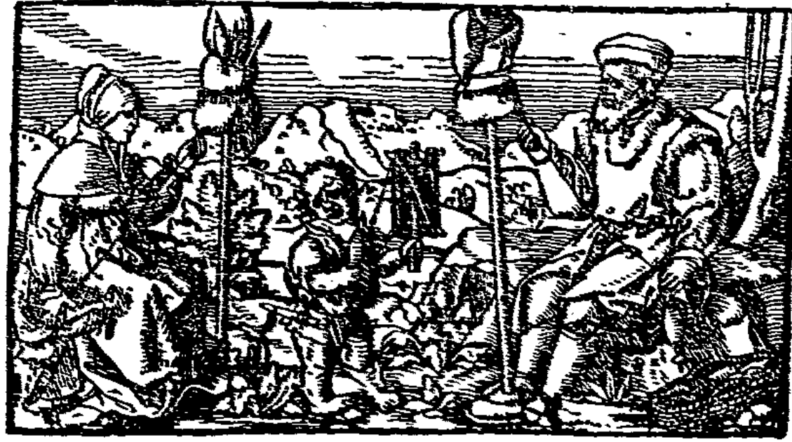
Abb. 7. Spinnerrad im Mittelalter.

höfen wurde. Die Entstehung der Städte aber war von tiefgreifender Wirkung auf das gesamte wirtschaftliche, soziale und politische Leben. Die Stadt wurde zum Sammelplatz für alle wirtschaftlichen Elemente, die mit ihrer Tätigkeit zur landwirtschaftlichen Tätigkeit der Fronhöfe im Gegensatz standen, also in erster Linie der Händler, der wohlhabenden Kaufleute, die die erste Klasse des sich entwickelnden Städtewesens wurden, dann aber auch der freien gewerblichen Arbeiter, die, ehemals in dem Frondienste