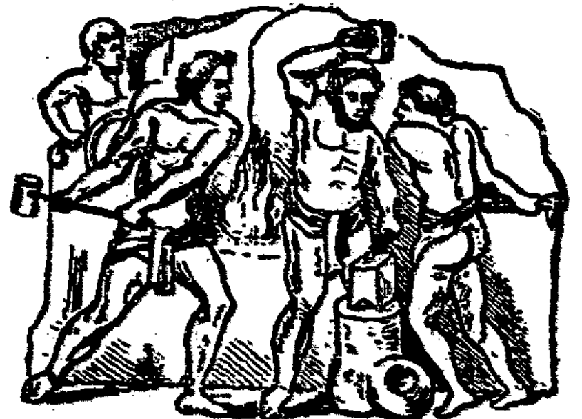
Abb. 4. Römische Großschmiede (ca. 100 n. Chr.).

In ungefähr derselben Form finden wir diese Wirtschaftsweise auch bei den altgermanischen Völkern vor, bei denen wir dieselbe Entwicklung der hauswirtschaftlichen Arbeit bis zum großen Wirtschaftshof