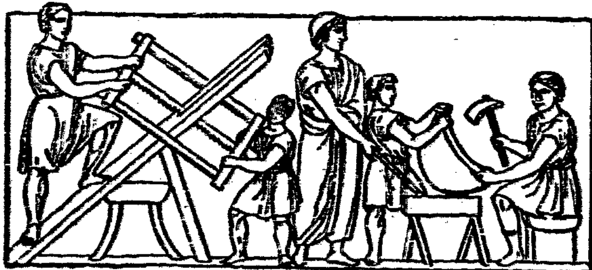
Abb. 3. Griechische Schmiedeleute (ca. 500 v. Chr.).

werblich-industrieller Natur, selbst erzeugte. Auch bei bereits sehr weit fortgeschrittener Kultur und technischer Entwicklung blieb das Handwerk bei Griechen wie Römern das Prinzip der Arbeitsweise, jedoch in wesentlich entwickelterer Gestalt, und zwar infolge, als in dem hauswirtschaftlichen Wirtschaftsbetrieb