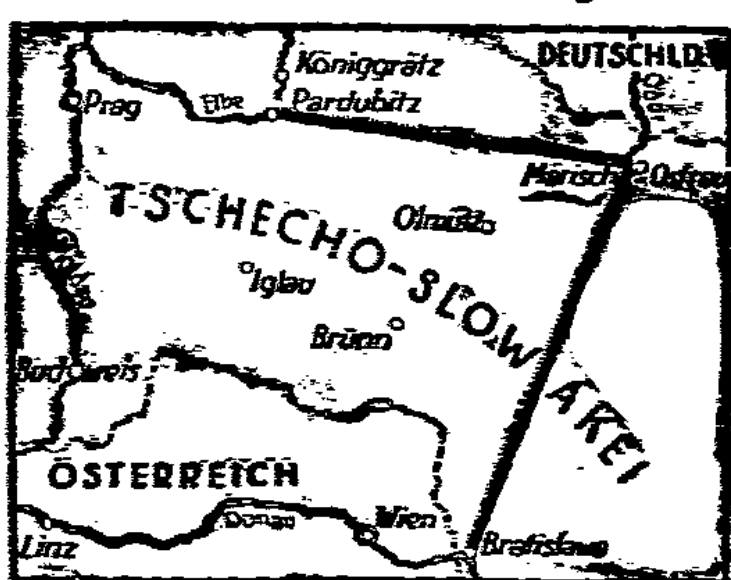
Strecke des geplanten Kanals