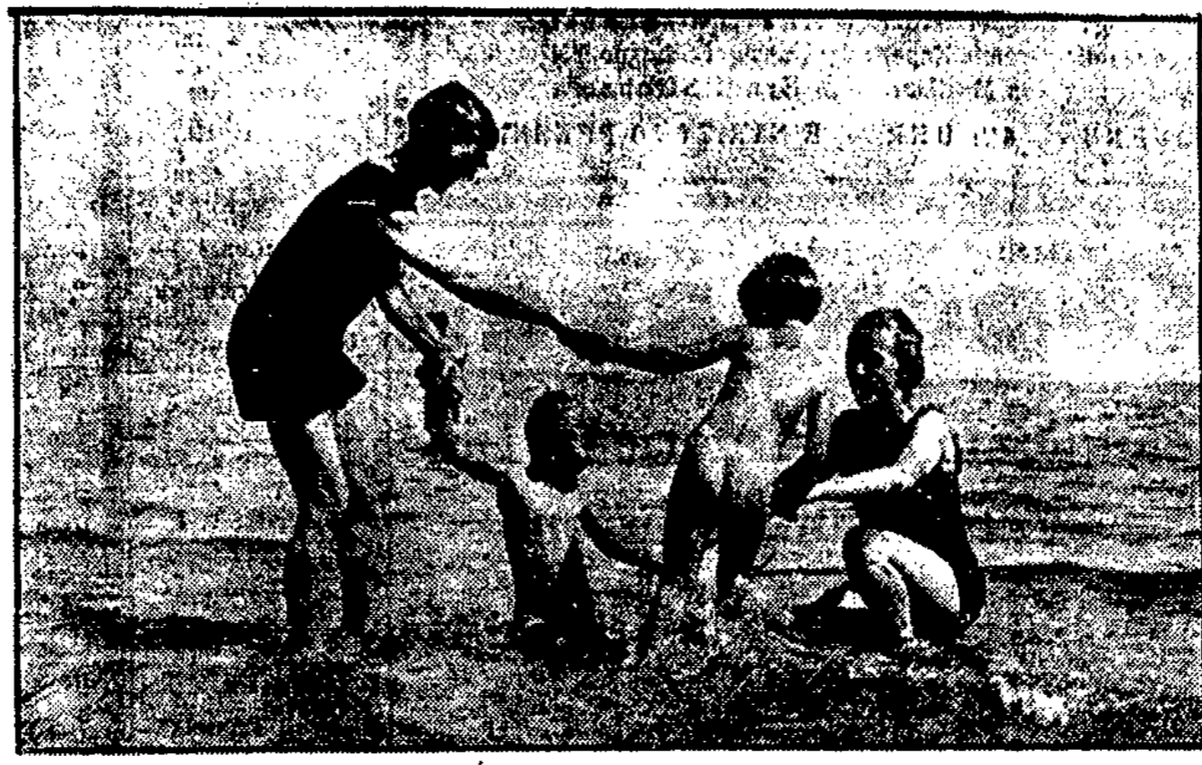
Die Ostseebäder mit ihren Gast- und Erholungskästen sind jetzt besonders beliebte Ausflugsorte.

Strandhalle Heubude Endstation der Straßenbahn Nr. 4 * Herrliche Seeterrasse Restaurant Café und Konditorei * Diners von 12 bis 3 Uhr * Reichhaltige Abendkarte Kaltes Büfett In meiner Kaffeeküche an der Strandpromenade : Kaffee in Tassen und Portionen zu kleinen Preisen, Mitgebrachter Kaffee wird aufgeführt. Beliebte Kaffee für Familien, Ausflügler und Vereine. M. GRABOW