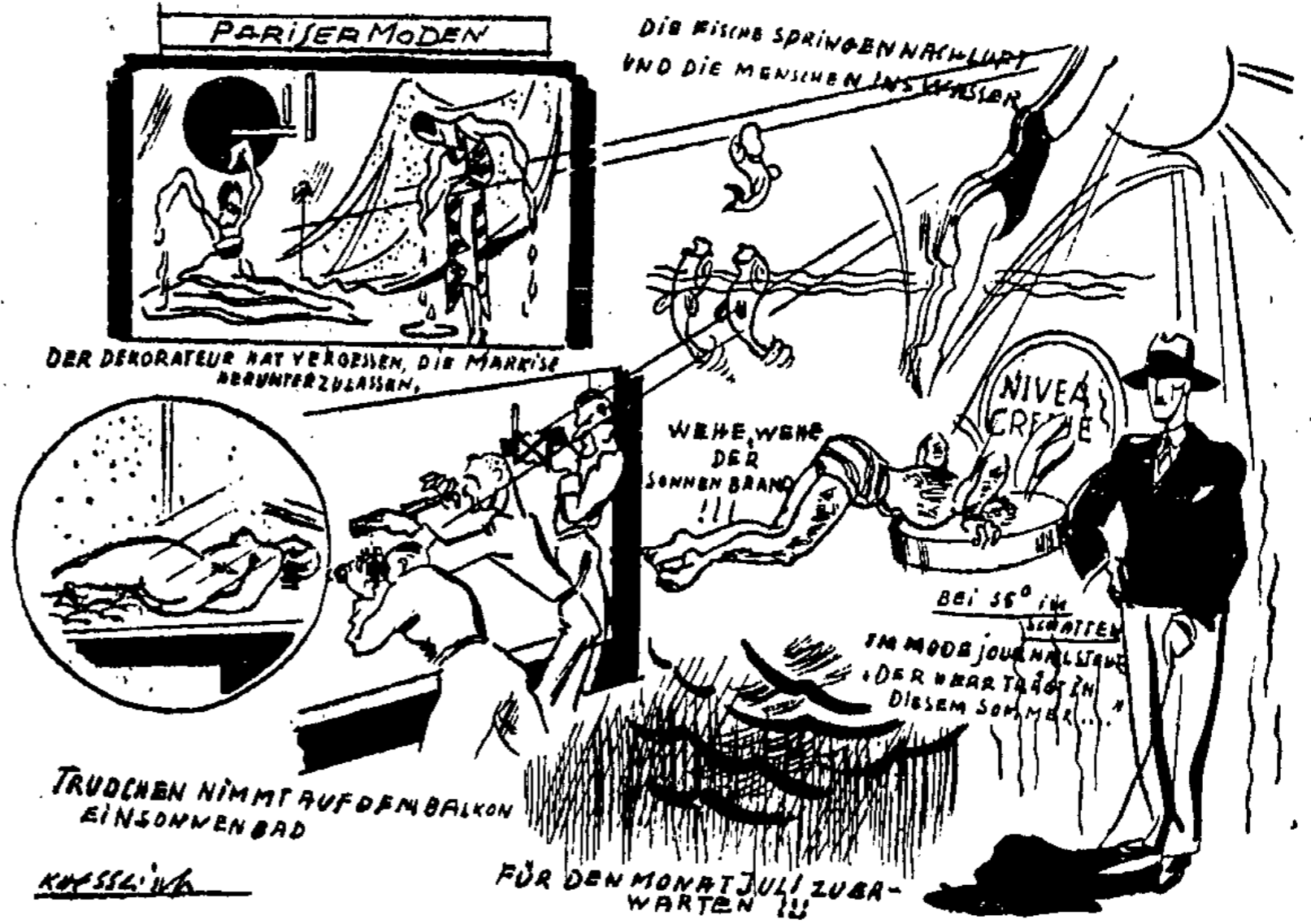
TRAUDLEN NIMMT AUF DEM BALCON EINSONNENBAD