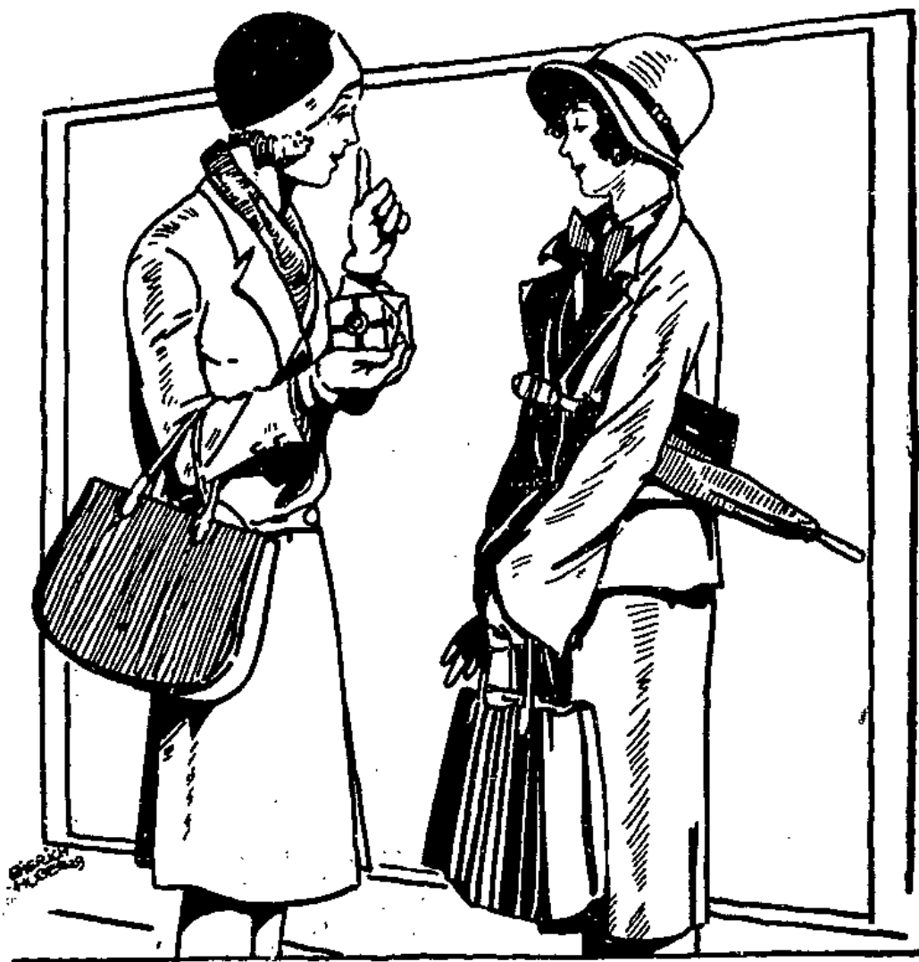
Es genügt nicht, dass Du Margarine forderst, Blauband muss es sein!