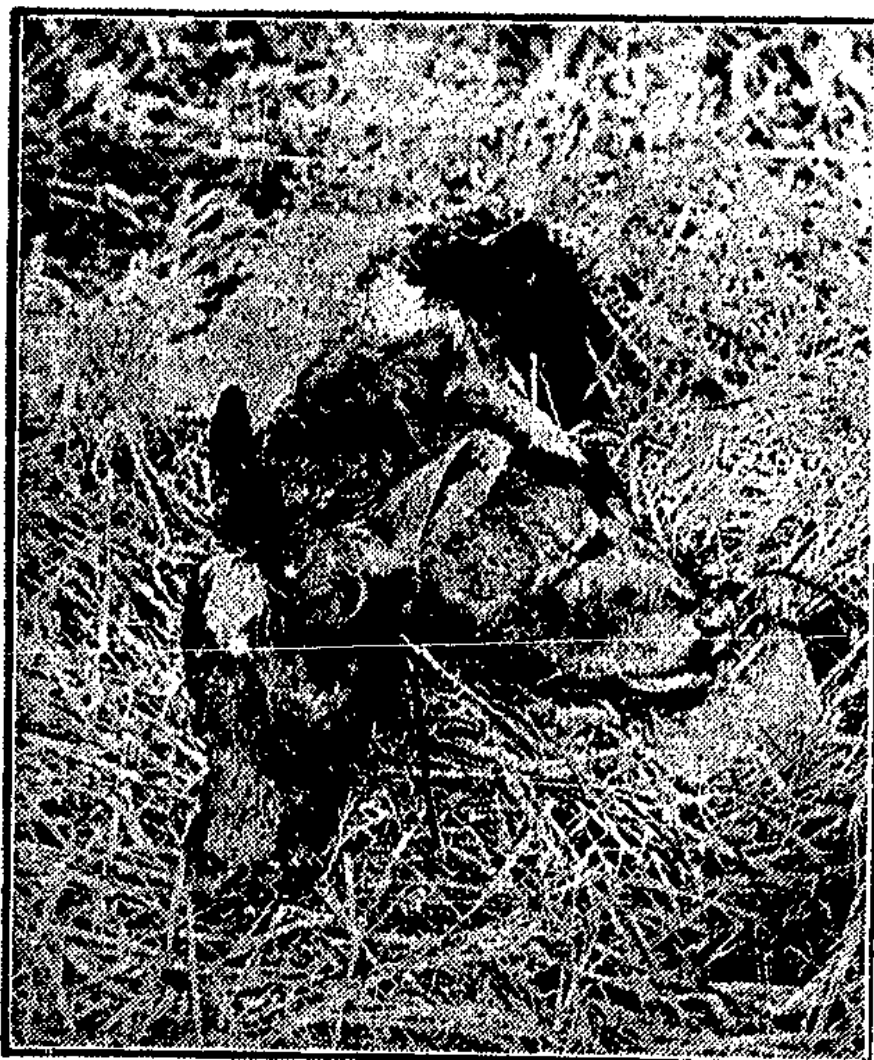
Das Kalb mit zwei Köpfen.

Um 12 Uhr machten wir am Lössenberg fest. So endete ein Tag, der leicht für mich einen anderen Ausgang hätte haben können.