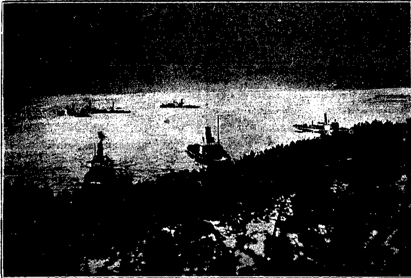
Zur Untätigkeit verdammt.

Das war das heitere Erlebnis auf der Fahrt. Sonst — wie gesagt, noch ist alles ruhig. Noch liegen da in einer weichen Fläche ein paar Schiffe. Ein wundervoller Anblick. Robote könnte, falls er jetzt noch den Ehrgeiz hat, Eis zu sehen, noch einmal die „Italia“ faheln und dann in unserer Bucht ein Kreuzchen abwerfen. Bis zum Eismeer braucht niemand mehr den Flug zu wagen. Hier kann er das selbe Schauspiel genießen. Aber wie lange noch? Die Winde werden — von diesem Ge-