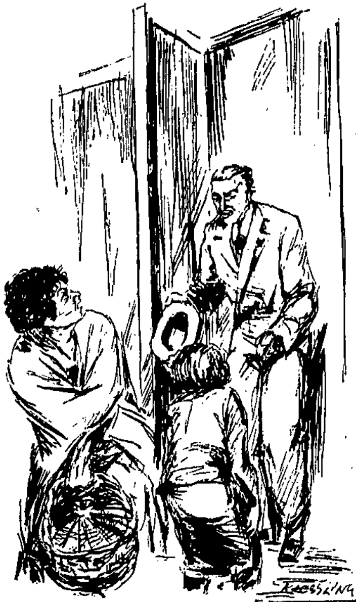
„Darf ich Sie bitten, mir ohne Aufsehen zu folgen.“

Victor strich sich etwas betäubt das Haar aus der Stirn. „Ja, das werden wir auch. — Ist die angegebene Adresse richtig?“ wandte er sich zu dem wieder eintretenden Jacobson, und als dieser nickte, gab er der sprachlosen Juanita die gestohlene Kasse: „Es tut mir sehr leid, daß Sie Pech gehabt haben. Ich kann mir denken, wie schwer es ist, nach einem so mühseligen Einkauf plötzlich alles wieder einzubüßen. Ich gebe Ihnen daher diese Kasse zurück, Sie