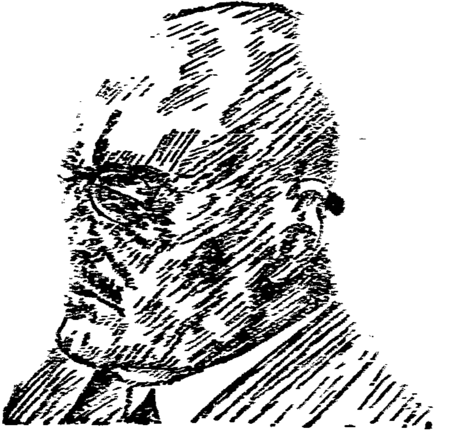
Reichsminister Dr. Entfer.

Die sozialdemokratische Reichsopposition hat sich am Freitagabend mit der allgemeinen politischen Lage der Reichsregierung befaßt. Die Opposition forderte unter dem Vorsitz der Reichsopposition die Regierung Entfer.