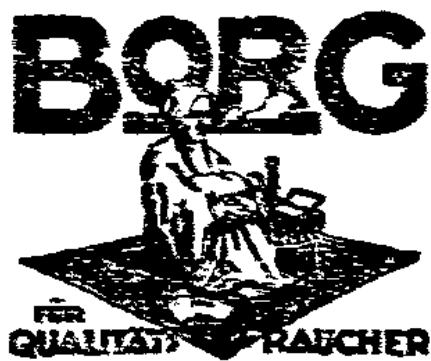
BORG QUALITÄT RAUCHER