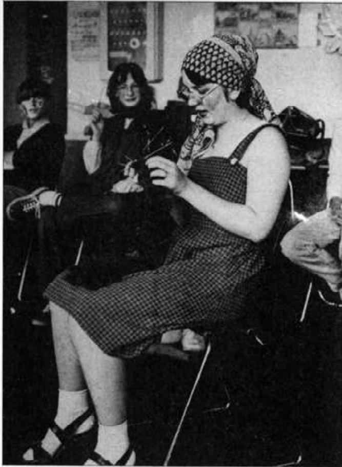
Mutter: Mein liebes Kind, so geht das aber nicht weiter! Ich kann mich schon nicht mehr an der Fleischtheke sehen lassen, so wie du aussiehst!