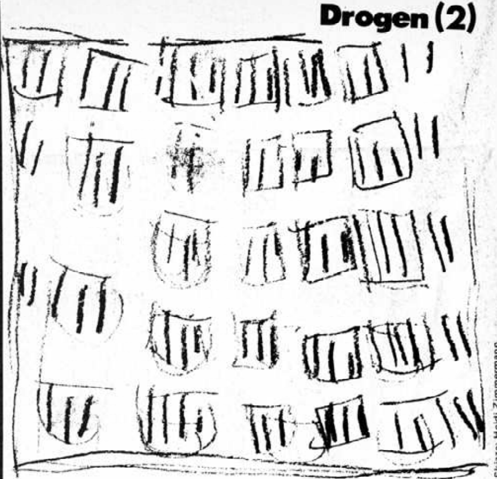
Skizze: Heidi Zimmermann

Den ersten Schuß setzen kannst du dir nicht alleine, weil du gar nicht weißt, wie's geht und weil du zuviel Angst hast.