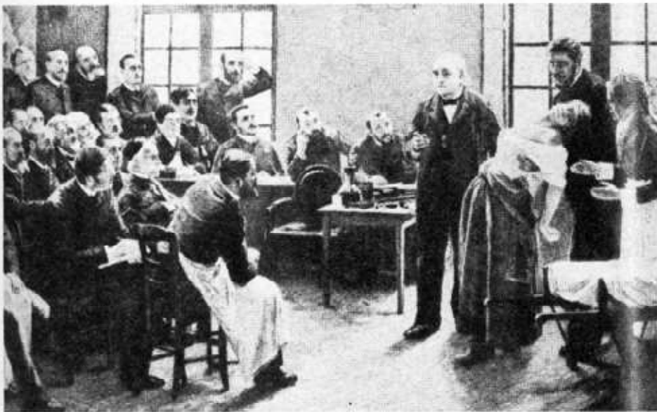
Der französische Arzt und Psychiater Charcot (1825–93) führt seinen Kollegen eine Patientin vor.