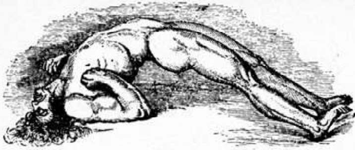
Zeichnung des berühmten 'Arc de Cercle', des 'hysterischen' Körperbogens, den der franz. Arzt Charcot in seiner Klinik immer wieder an Patientinnen beobachtete.

Sexualität zu thematisieren. Das Tier war entgültig zum Halteorgan für die Fortpflanzung der bürgerlichen Klasse reduziert worden. Gemessen an dieser Einengung mutet die immerhin noch auf sexuelle Unbefriedigung spekulierende Überlegung eines Arztes um 1830 „warum sich die Nonne Agnes Blaubekin, die an Hysterie litt, unaufhörlich mit dem Gedanken quälte, was wohl aus dem Theile geworden sey, der bei der Beschneidung Christi verlorenging“, geradezu fortschrittlich an gegenüber Kirchoffs Lehrbuch der Psychiatrie, Leipzig 1892, das zu einer Zeit, als Freud mit der Analyse der Anna O. den Zusammenhang zwischen Sexualität und Hysterie lebensgeschichtlich erfragt hatte, all dies vom Tisch wischte: „Es wird behauptet, daß die Enthaltbarkeit vom Geschlechts-genusse von üblen Folgen sei und eine Anlage zu geistigen Störungen begründe. Ganz besonders soll dies bei Frauen zur Erscheinung kommen. Eine solche Überschätzung der Bedeutung geschlechtlicher Befriedigung dürfen wir nicht wie das Publikum vornehmen. Bei Frauen ist vielmehr die Nichterfüllung des idealen Berufes der Gattin und Mutter das eigentliche, psychisch wirksame Moment.“