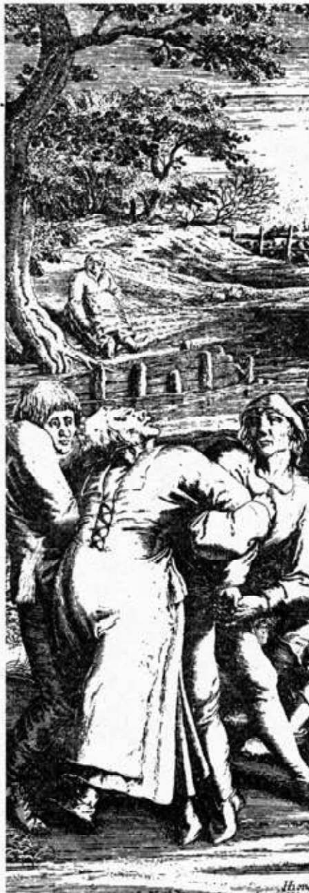
„Die Besessene von Molenbeek“. Stich von Pieter Breughel d.Ä., Mitte des 16. Jhdts. (Ausschnitt)

Was lag näher als die gepredigte körperliche und psychische Schwäche in einer Krankheit zuzuspitzen, die die Irrwitzigkeiten des weiblichen Kulturcharakters nur bis zur äußersten Konsequenz hin darstellte? Nicht mehr zu sprechen, da sie ohnehin nichts sagen durften, nicht mehr zu gehen, da doch ohnehin ihr Umkreis engstens begrenzt war, dauernd zu erbrechen, weil allzuviel geschluckt werden sollte. Starr, steif, unempfindlich zu werden, oder auf die sexuellen Annäherungen, die ihr doch nichts bringen sollten als neuerliche Arbeit, mit Hyperästhesie, d.h. „Überempfindlichkeit“ bis hin zum Vaginismus zu