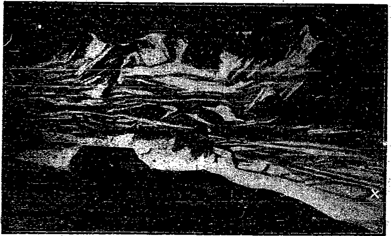
Die Gondel des Piccard'schen Sirotophärenballons ist beim Abtransport von der Gurgler Alp 200 Meter tief in den Gurgler Eisbach gestürzt und kann, wenn überhaupt, nicht vor dem Sommer geborgen werden.

Das Kreuz bezeichnet die Stelle, wo sie im Wasser liegt