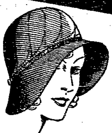
Jugendliche Glocke mit Schliff und Band- garnitur 2 75

unsere Kunden über den niedrigen Preis, für den sie bei uns schon einen feschten Hut bekommen. Die riesenhafte Auswahl und die winzigen Preise erkennen auch die Anspruchsvollsten und die Sparsamsten an. Eine eigene Hut-Fabrik ist der Grund unserer überragenden Leistungsfähigkeit.