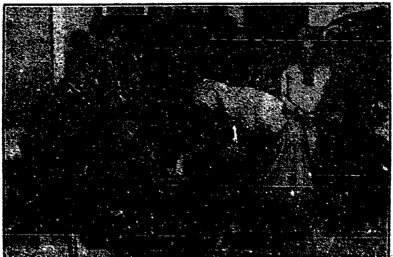
Kemal Paşa hat die Türkei mit allen modernen demokratischen Einrichtungen versehen. Unter Bild zeigt einen Wahlakt in der türkischen Türkei — in einem kleinen Dorfe. Unen gibt es keine Wahl, sondern eine „Schlichtung“.