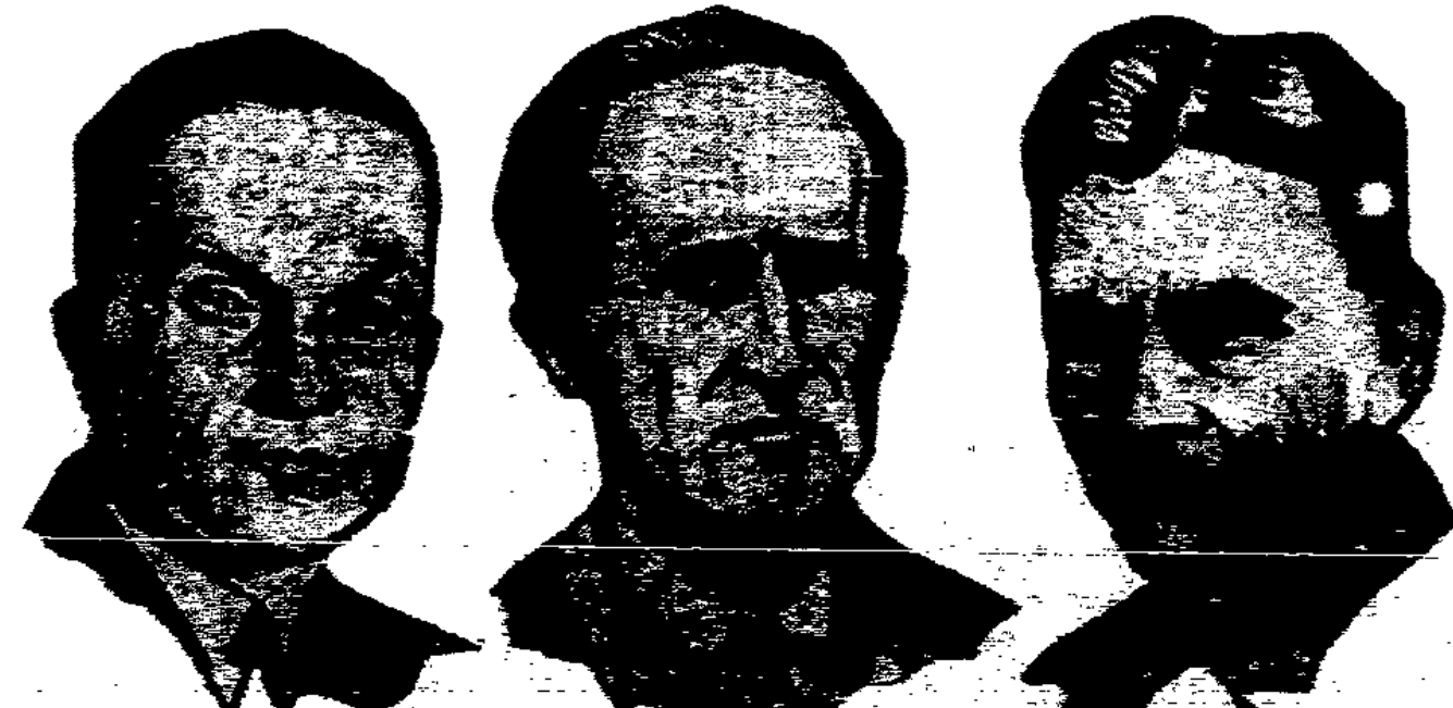
An der Spitze des Europa-Fluges

Gehter Sonntagabend auf dem Flugplatz — Breslauer Kampfflieger abgeführt Die durch ein Wunder unversehrt