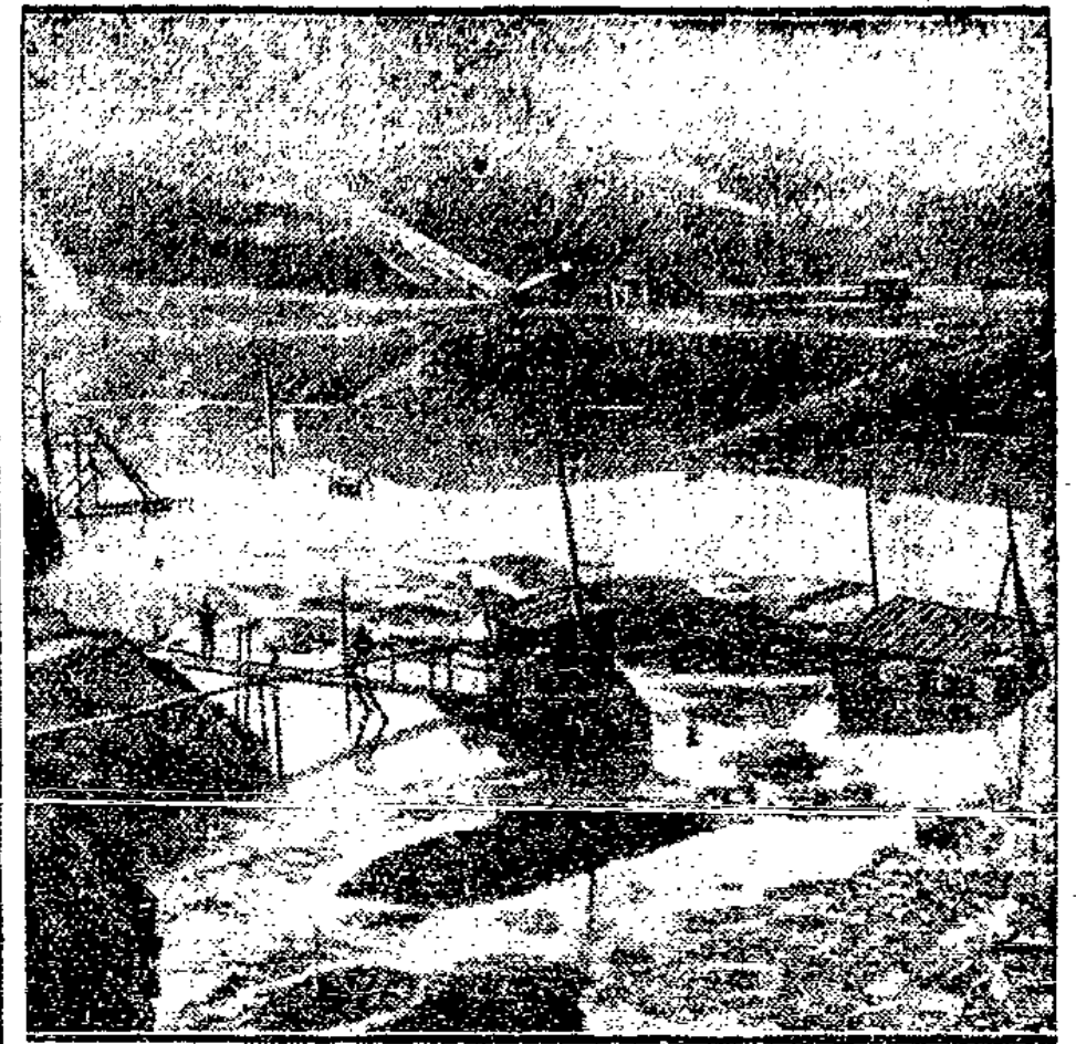
Unser Bild zeigt den bei der Unwetter-Katastrophe unter Wasser