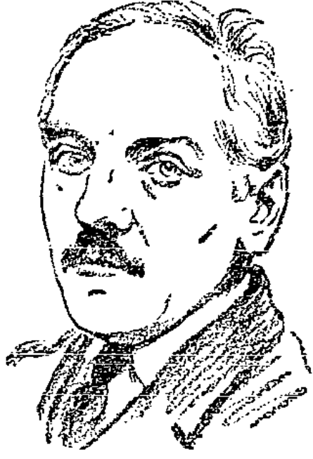
Rylenko tritt für den Obersten Staatsgerichtshof die Anklage.

Das größte Flugzeug der Welt geht auf der Schweizer Dornier-Werft seiner Vollendung entgegen. Es wird noch im Laufe dieses Jahres die Werft verlassen. Seine zwölf Motoren sind in paarweiser Anordnung auf den riesigen Tragflächen verteilt und arbeiten mit je zwei und je drei Druckpropellern, die eine Gesamtleistung von 5000 Pferdekraften entfalten können. Die gesamte Motorenanlage ist um etwa die Hälfte stärker als die des neuen in Friedrichshafen erbauten Zeppelinluftschiffes. Das als Flugboot gebaute Flugzeug ist für den Dienst über den Ozean bestimmt und bietet Raum für 25 bis 30 Passagiere, große Frachtmengen und Post. Die Riesenmaschine soll den geregelten Transoceanverkehr verwirklichen. Zwei Piloten, zwei Monteurs, ein Junker und wahrscheinlich auch ein Kapitän werden die Besatzung bilden.