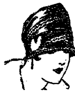
Nr. 110 Mod. Seidenhut u. Strohhüte Verarbeit. u. Agraftengarn- nierung 4.50

Unerreicht in Preiswürdigkeit und Geschmack