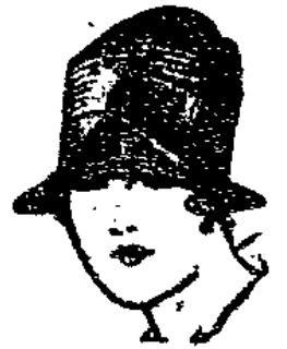
Nr. 110 Mod. Damenhut mit br. Band, elast. u. wasser- farb. Bandgar. 6.50

Bitte, beachten Sie meine 4 Schaufenster und die Ausstellungskabinette schräggelagert