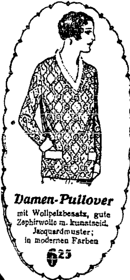
Damen-Pullover mit Wollpelzbesatz, gute Zephyrwole m. Kunstseide, Jacquardmuster, in modernen Farben 625

Herren-Trikothemd , solider wollgemischter Wintertrikot, normalfarbig, mit doppelter Brust, Mittelgröße Passendes Beinkleid . . . . . 295 Herren-Trikothemd , vorzügl. Qual. mit plüschartig geraubter Innenseite, grau oder mode . . . Mittelgröße Passendes Beinkleid . . . . . 390 Einsatzhemd , wollgemischter Wintertrikot, normalfarb. mit gestreiften Rips- oder Pikee-Einsätzen . . . . . 390 Leibchenhose für Kinder, wollgem. Wintertrikot, normalfarb., Länge 60 cm jede weitere Größe 15 Pfg. mehr. 175