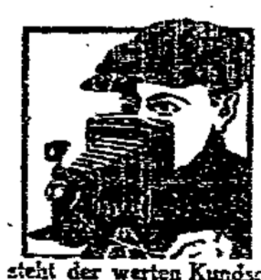
Foto-Liebhaber! Hiermit zeige ich ergebenst an, daß ich meinem Droger- Farben- und Parfümerie- Geschäft eine Abteilung für fotografische Bedarfsartikel angegliedert habe. — Eine geräumige Dunkelkammer steht der werten Kundschaft jederzeit zur Verfügung, auch werden sämtliche Foto-Arbeiten (Entwickeln, Kopieren usw.) prompt und sauber ausgeführt.

Meine Schlager Tagal Pizot M. 7.00 Tagal Pizot M. 6.75 Kitt-Kreischmied Wallstraße 7, an der Graupenstraße. Chausseur Stück 0.99, 1.50 Unverfälschte billigst und rasch schwarz innerhalb 24 Stunden.